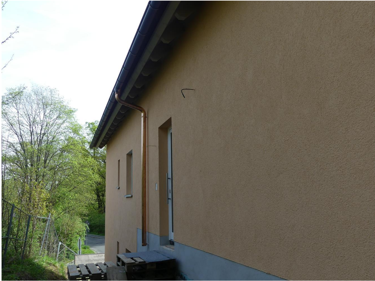
Ansicht von Süden