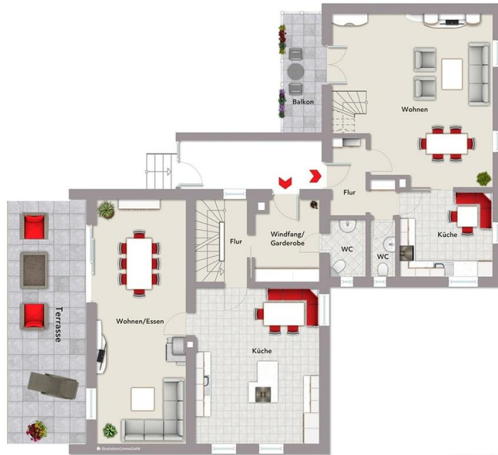
Exposierplan, nicht maßstäblich