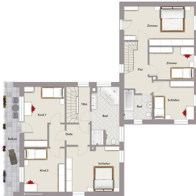
Exposierplan, nicht maßstäblich