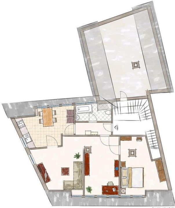
Expositplan, nicht maßstäblich