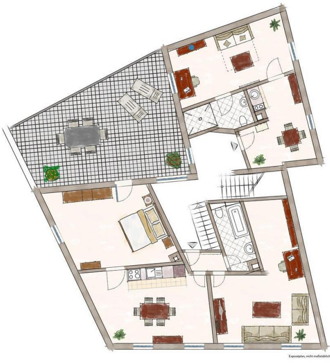
Exposéplan, nicht maßstablich