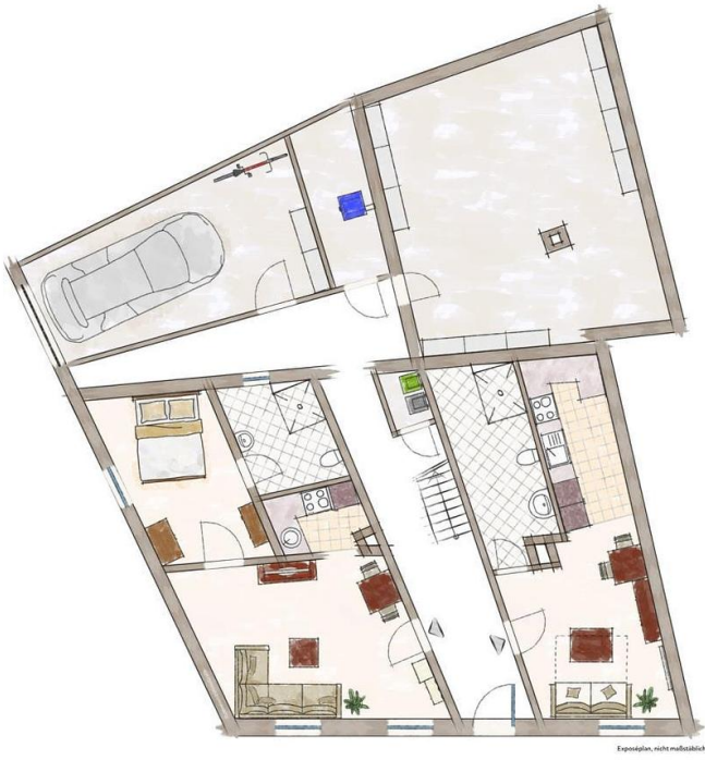
Exposéplan, nicht maßstablich