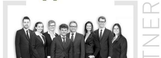
Kirsch & Häubner Immobilien, Neumarkt „Sie entscheiden – wir kümmern uns um den Rest!“