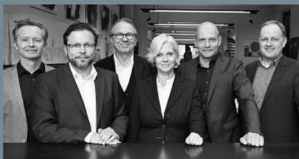
Berschneider + Berschneider, Architekten BDA + Innenarchitekten „Anspruchsvolle Architektur aus einem Guss.“

Wir verwandeln Träume in Bauwerke – durch Planung, Inspiration, Handwerk und Know-how – und sind Ihr zuverlässiger Partner.