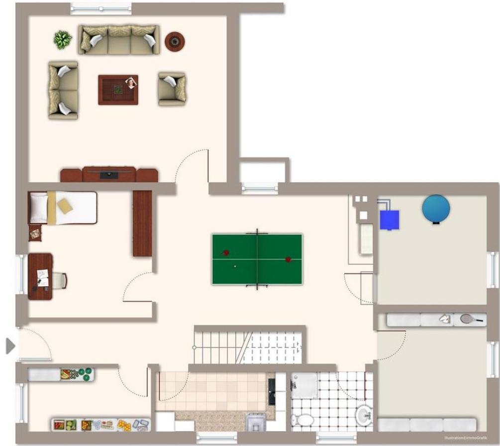
Illustration: Dennis Greik Exposéplan, nicht maßstäblich