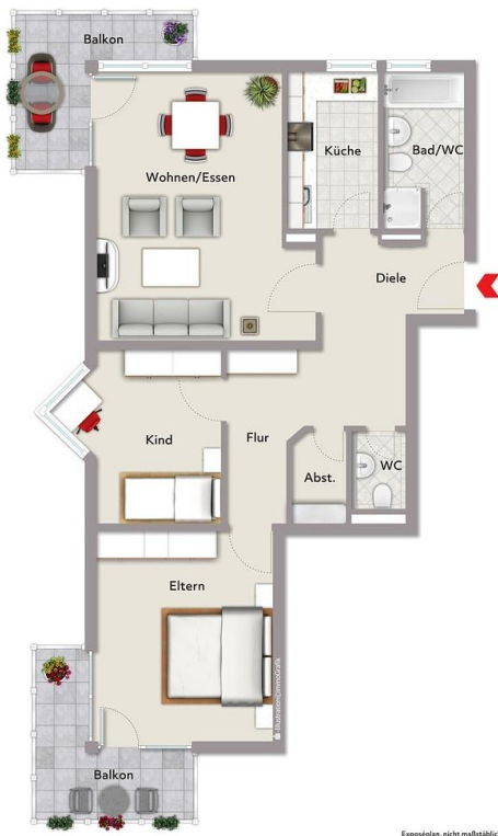
Exposiplan, nicht maßstäblich