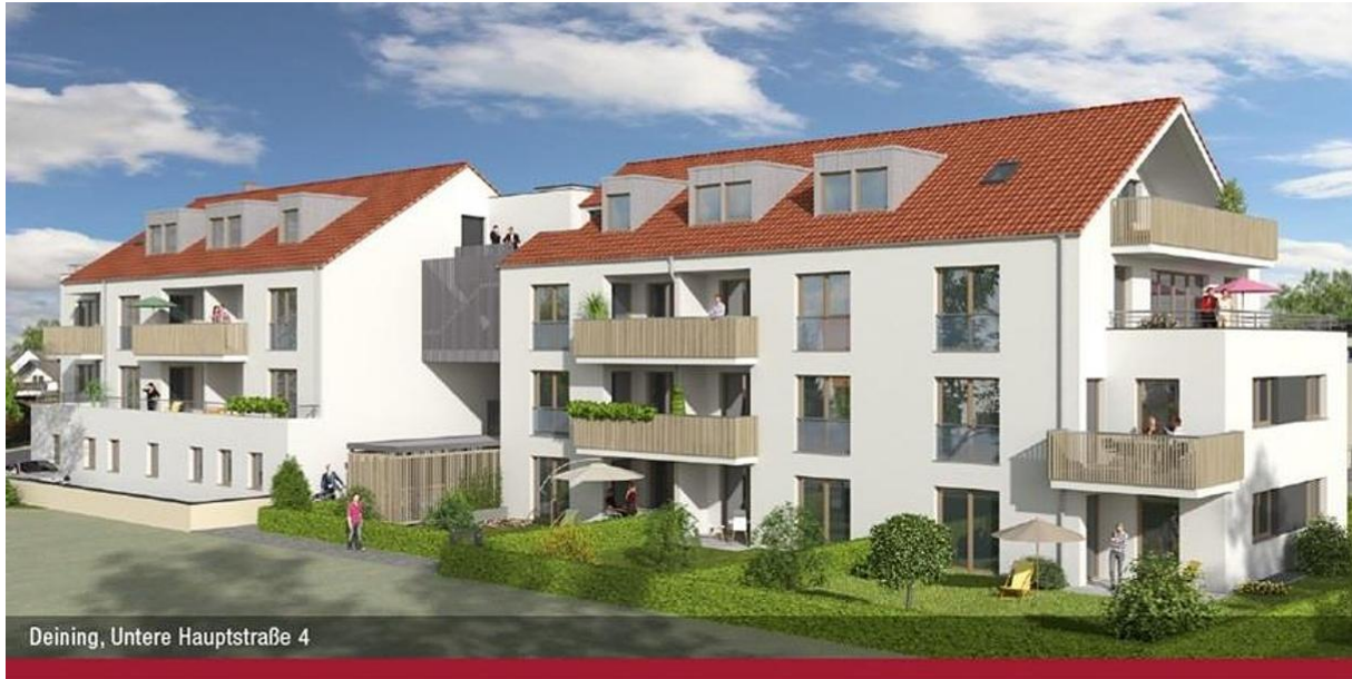
Deining, Untere Hauptstraße 4