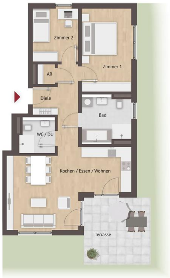
Grundriss-Illustration zur Maßentnahme nicht geeignet. Abbildung kann von endgültiger Bauausführung abweichen.